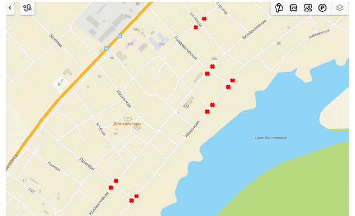
Приложение 2 к распоряжению администрации сельского поселения Васильевка от 19.07.2021 №531

Приложение 1 к распоряжению администрации сельского поселения Васильевка от 19.07.2021 №531